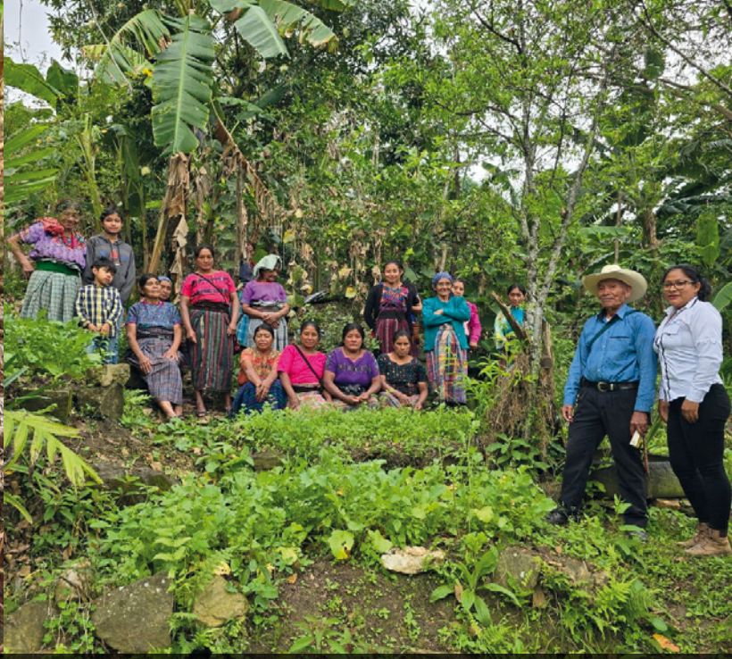
GUATEMALA. Mujeres productoras.