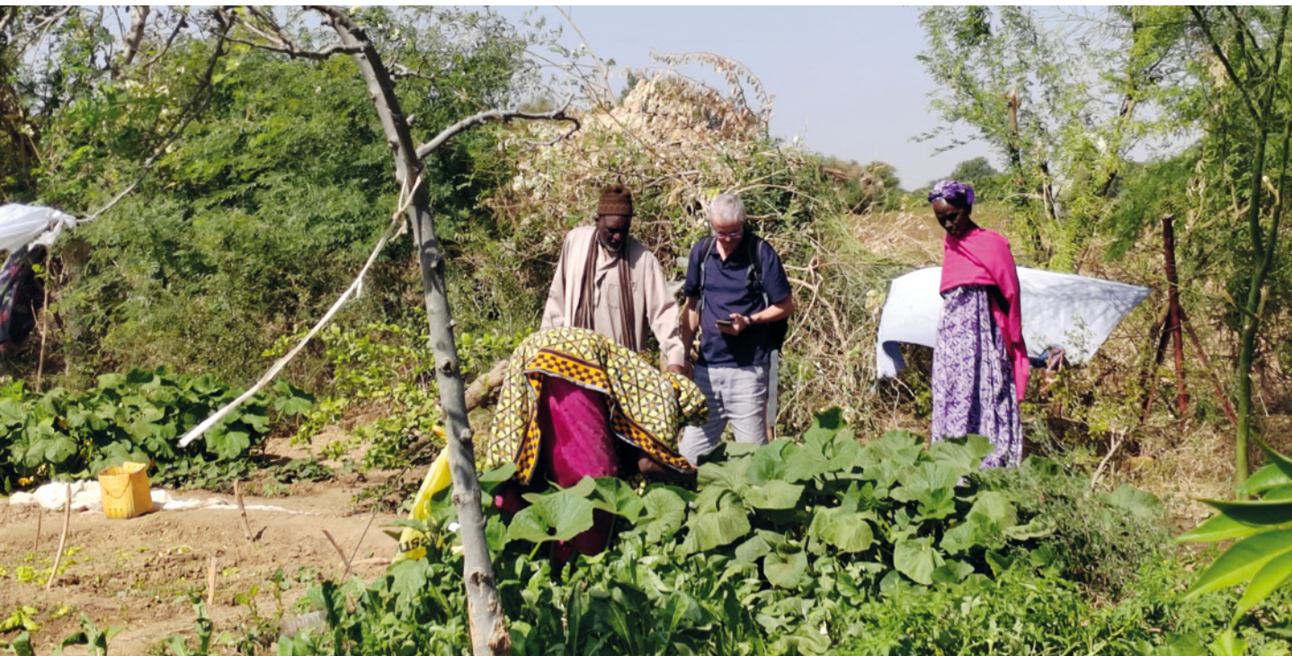
SENEGAL. Fortaleciendo capacidades en la producción local.