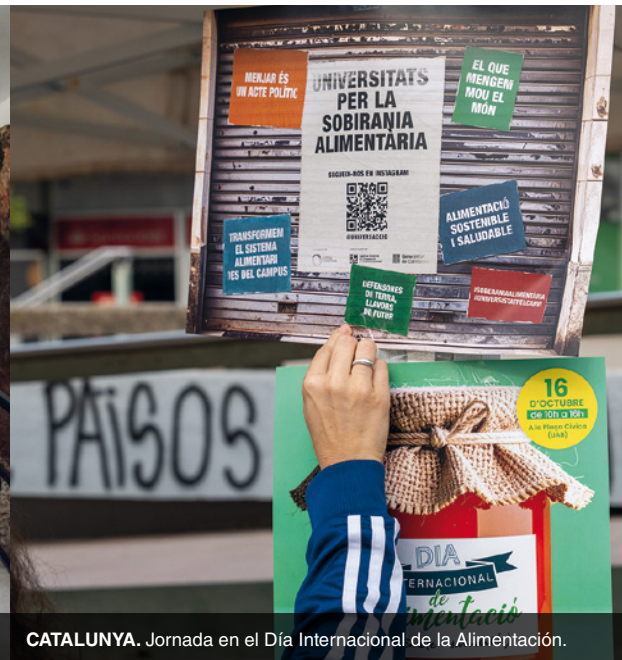
CATALUNYA. Jornada en el Día Internacional de la Alimentación.