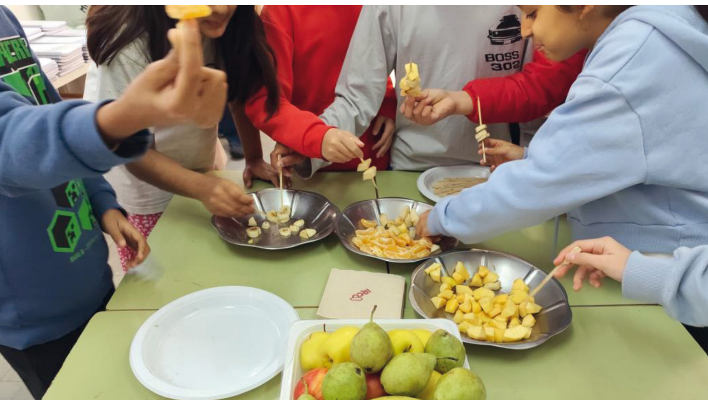
PAÍS VALENCIÀ. Promoción del consumo de frutas y verduras de temporada en la fiesta de Navidad de un colegio.

Comisión de Comedor , uno en Mallorca y otro online, y un taller para el personal de cocina de los comedores escolares en Mallorca. En diciembre se organizó la II Jornada para dar a conocer iniciativas exitosas en las Illes Balears. Se ha elaborado un catálogo de producto ecolocal para comedores escolares y cafeterías.