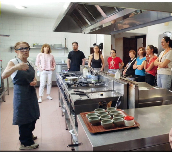
ANDALUCÍA. Taller de cocina en el IES El Carmen.