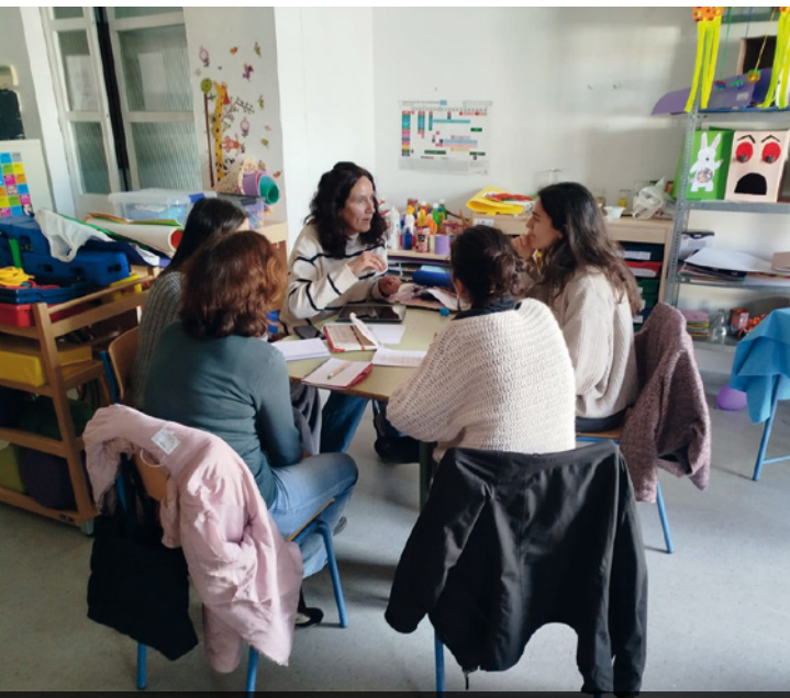
ANDALUCÍA. Grupo de trabajo de formación al profesorado.