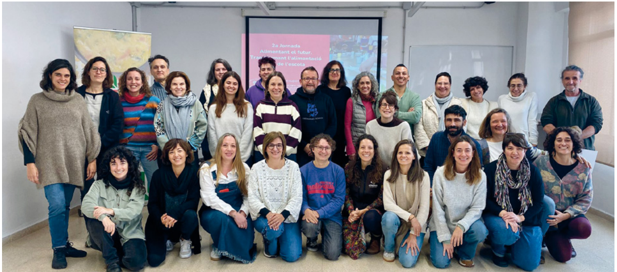
ILLES BALEARS. Participantes en la II Jornada de Alimentat el futur.