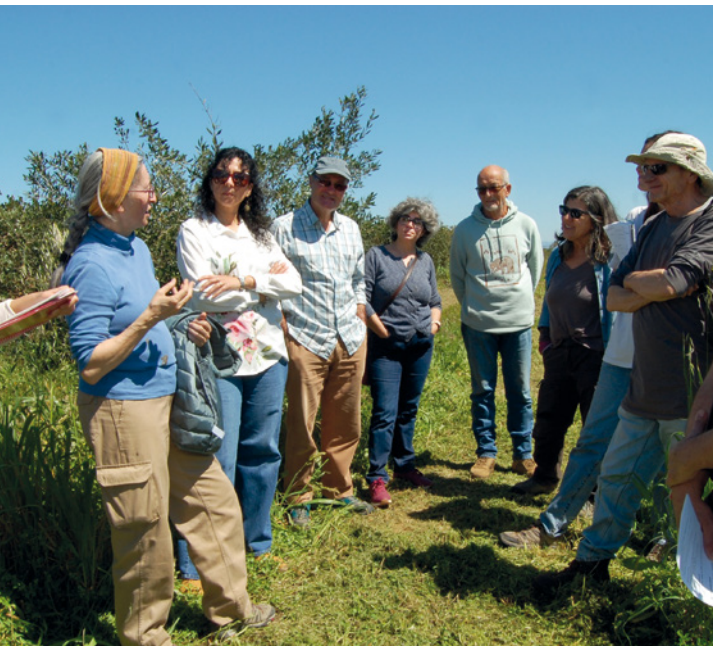
ANDALUCÍA. Campaña GO Sistemas Participativos de Garantía.