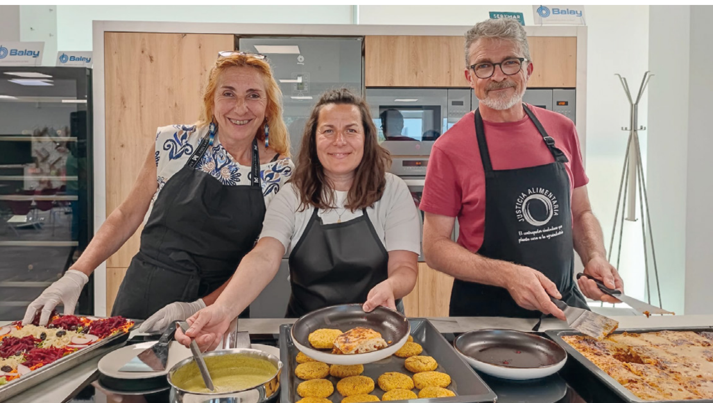
ARAGÓN. Jornadas de intercambio de experiencias entre personal de comedores escolares.