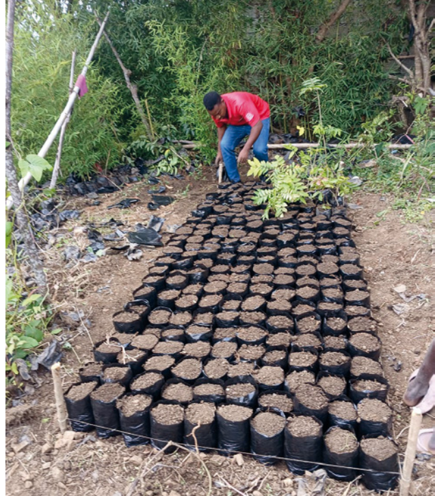
HAÍTÍ. Instalación de microvereros.

En el marco de la campaña Comiendo mentiras se han reforzado espacios multisectoriales de diálogo como la Mesa de Seguridad Alimentaria y Nutricional , desde la que se han impulsado acciones de sensibilización sobre etiquetado responsable y consumo agroecológico.