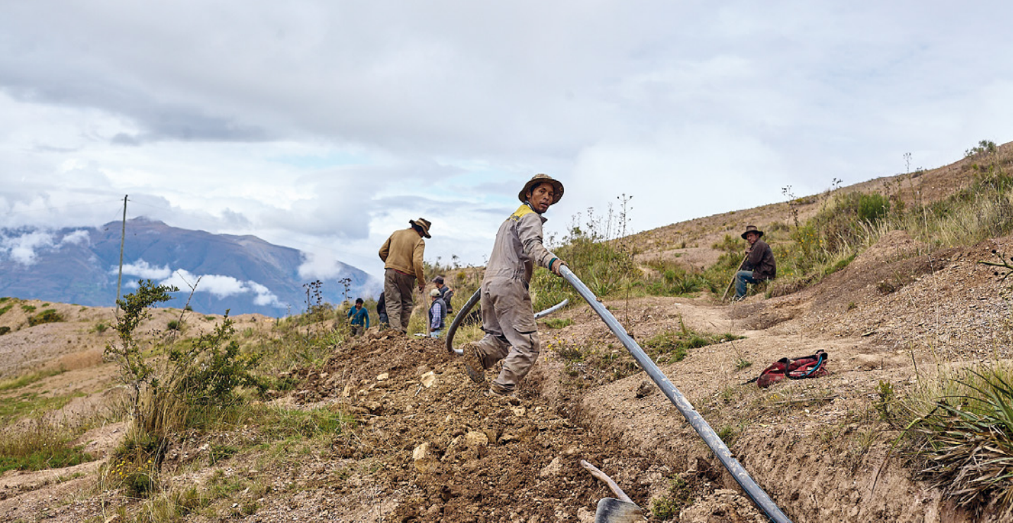
BOLIVIA. Instalación de sistemas de riego.