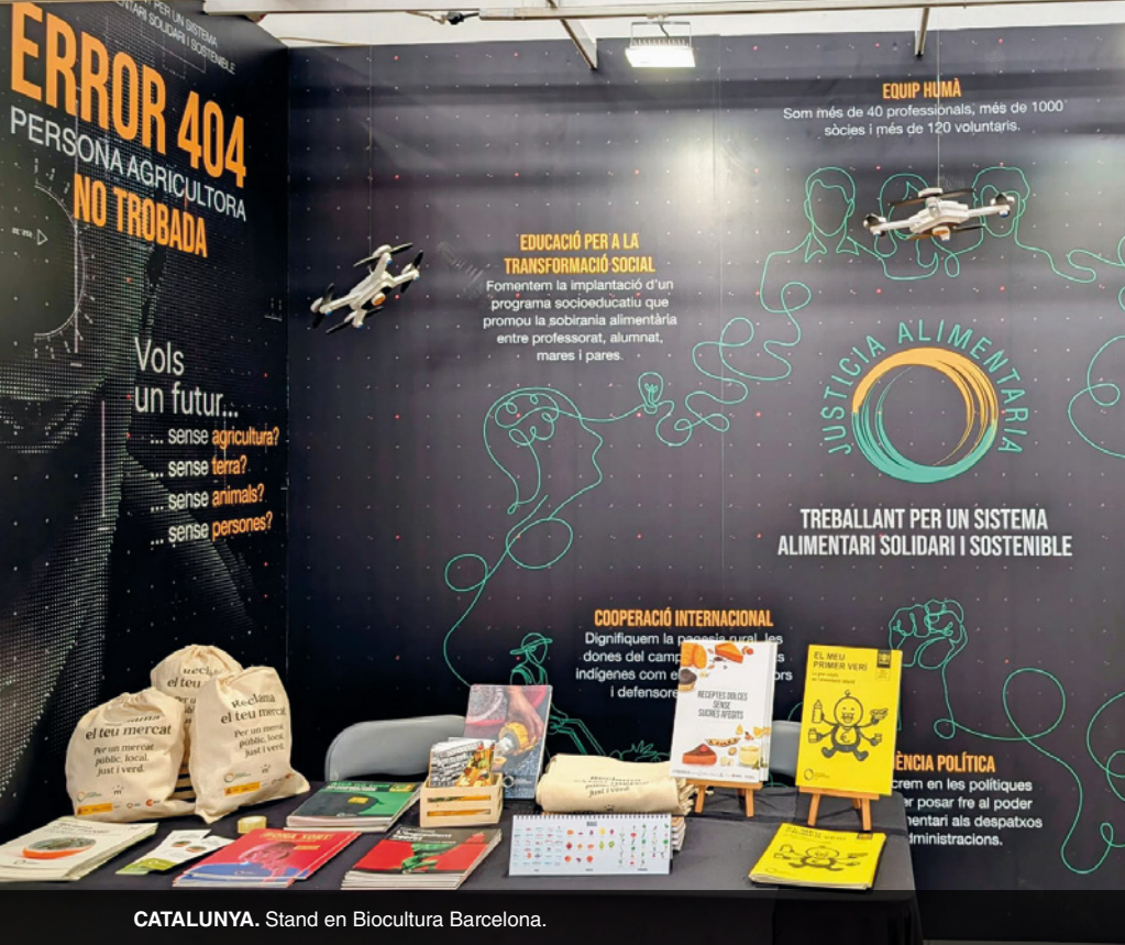
CATALUNYA. Stand en Biocultura Barcelona.