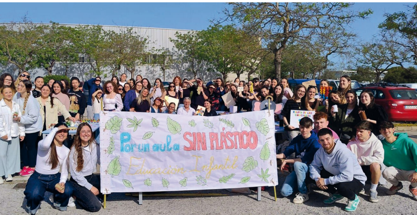
ANDALUCÍA. Alumnado de la Facultad de Ciencias de la Educación de Cádiz en la inauguración de su exposición Aula sin Plástico .