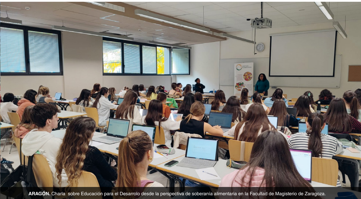
ARAGÓN. Charla sobre Educación para el Desarrollo desde la perspectiva de soberanía alimentaria en la Facultad de Magisterio de Zaragoza.

la perspectiva de la soberanía alimentaria en las facultades de Magisterio de Huesca y Zaragoza .