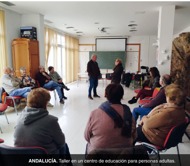
ANDALUCÍA. Taller en un centro de educación para personas adultas.