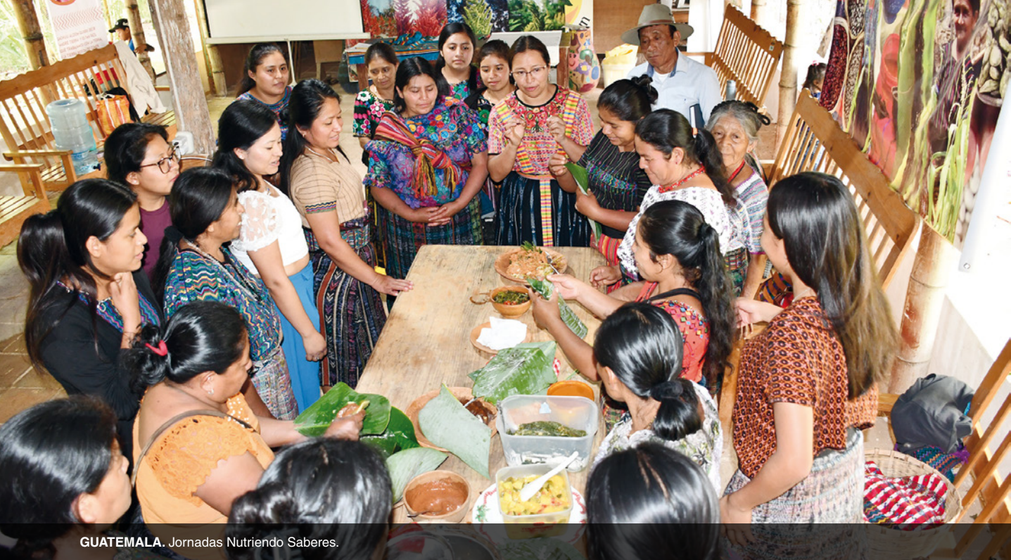
GUATEMALA. Jornadas Nutriendo Saberes.