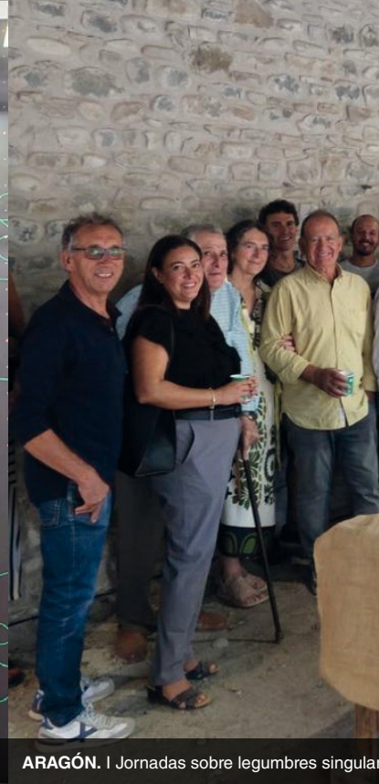
ARAGÓN. I Jornadas sobre legumbres singulares.