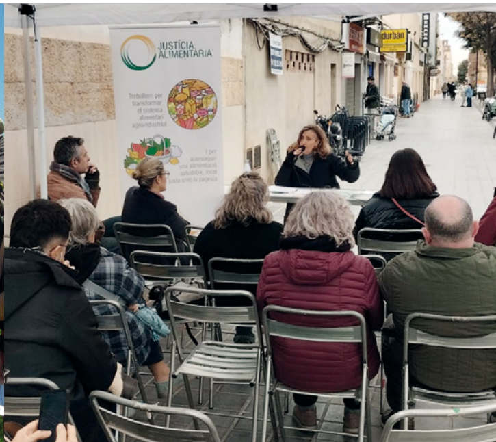
PAÍS VALENCIÀ. Presentación de la campaña ¡Reclama tu mercado!