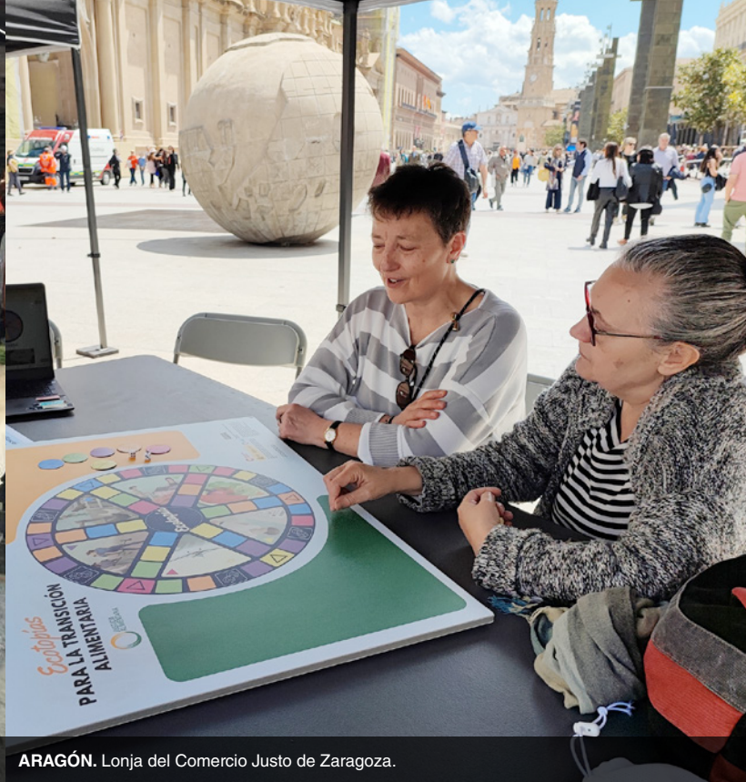
ARAGÓN. Lonja del Comercio Justo de Zaragoza.

con la participación de unas 470 personas, entre alumnado y profesorado. El alumnado de diferentes institutos presentó sus propuestas para transformar el sistema alimentario, participando también en actividades educativas y dinámicas colectivas.