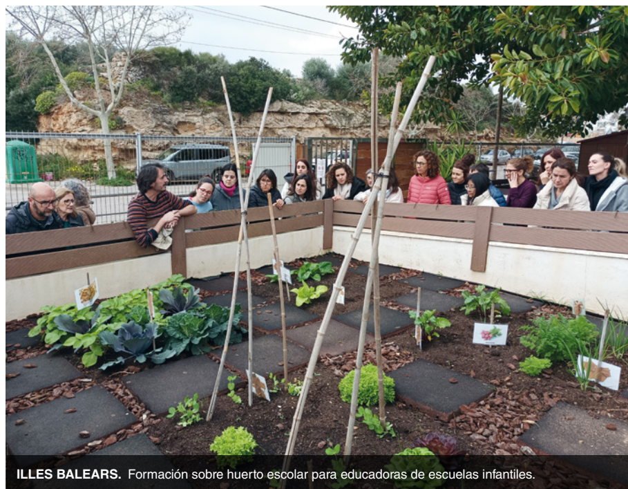
ILLES BALEARS. Formación sobre huerto escolar para educadoras de escuelas infantiles.

Con alumnado de la asignatura TIC para Artes y Humanidades, trabajamos la elaboración de documentales con perspectiva educativa; y con el del grado de Educación Infantil, visitamos la experiencia agroecológica Sembrando en Saó.