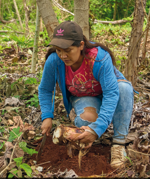
BOLIVIA. Recuperación de prácticas productivas.