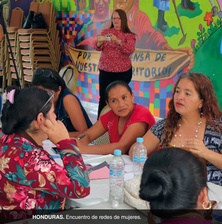
HONDURAS. Encuentro de redes de mujeres.